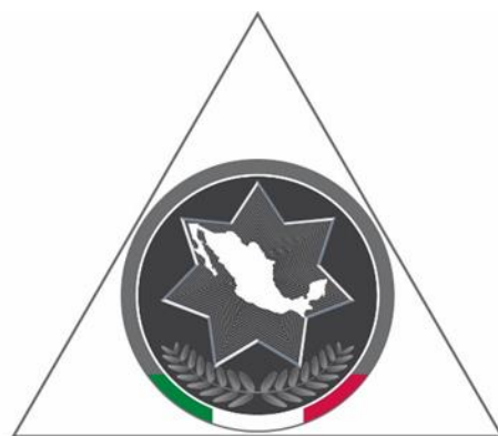
Conferencia Nacional de Secretarios de Seguridad Pública